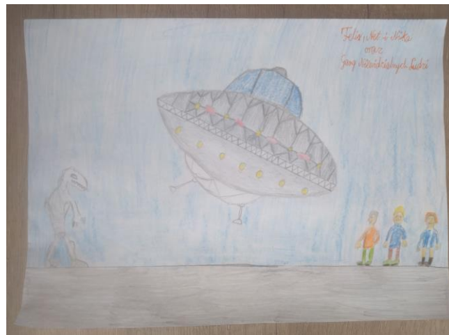
praca Wojtka Mikołajczaka „Feliks, Net i Nika oraz Gang Niewidzialnych Ludzi” R. Kosika

Od 9 listopada 2020r. zajęcia w szkole odbywają się online. Tylko klasom I- III udało się 17 stycznia wrócić do szkoły na lekcje stacjonarne. Mogą one jednocześnie korzystać ze zbiorów szkolnej biblioteki.