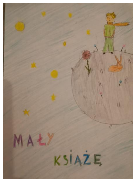
„Mały Książę” A. de Saint – Exupéryego rys. Justyny Gabryszewskiej